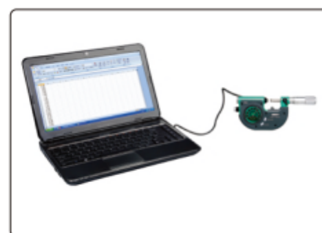
Вывод данных через USB-кабель (включено)